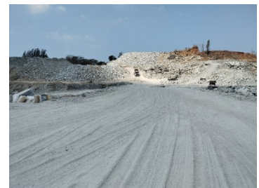
เส้นทางขนส่งแร่ในพื้นที่โครงการ