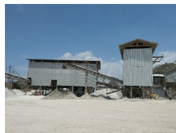
โรงโม่หินของโครงการ