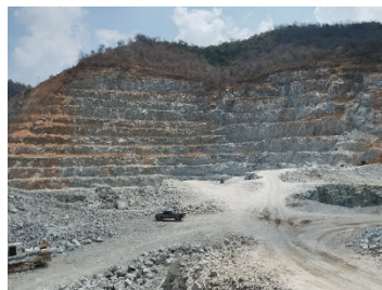
หน้าเหมืองปัจจุบัน

พื้นที่โครงการ ประทานบัตรที่ 21379/15245