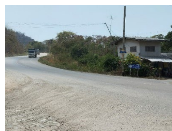
ทางหลวงหมายเลข 3144